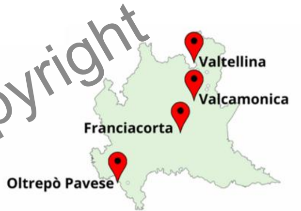
Localizzazione dei vigneti di confronto varietale