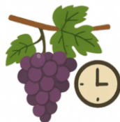
EPOCHE DI MATURAZIONE

La precedente esperienza del progetto VITAVAL ( Vitigni resistenti le crittogame: studio, adattamento e valorizzazione in Lombardia ) ha evidenziato come i vitigni PIWI mostrino comportamenti molto diversi tra loro e tra gli ambienti di coltivazione , con un' ampia variabilità nelle epoche di maturazione e nella qualità delle uve. Si tratta di informazioni preziose per scegliere le combinazioni vitigno-ambiente più adatte alle caratteristiche pedoclimatiche ed agli obiettivi enologici dei diversi areali lombardi.