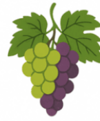
QUALITÀ DELLE UVE