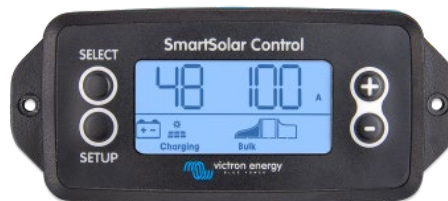
Display a spina SmartSolar