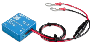
Rilevamento Bluetooth: Rilevatore Smart Battery