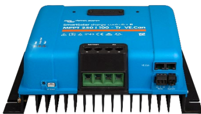
Regolatori di carica SmartSolar MPPT 250/100-Tr VE.Can senza display