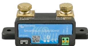
Display a spina SmartSolar