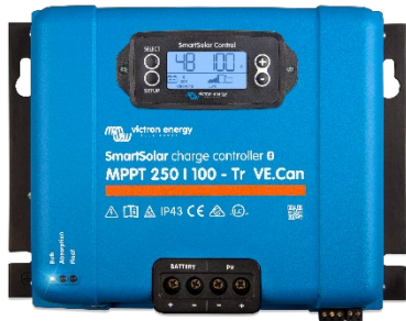
Regolatori di carica SmartSolar MPPT 250/100-Tr VE.Can con display a spina opzionale