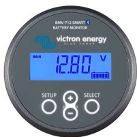
Rilevamento Bluetooth: Dispositivo di controllo della batteria Smart BMV-712