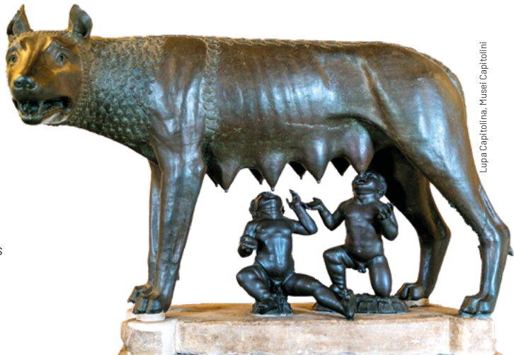
Lupa Capitolina, Musei Capitolini