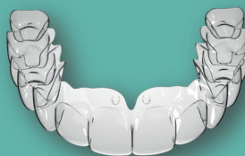
Allineatori Nuvola® Pro™

OP System™ è un innovativo protocollo ortodontico che unisce alla terapia ortodontica con allineatori trasparenti la correzione della funzione linguale e dell'equilibrio muscolare del sistema stomatognatico.