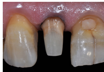
Caso clinico n.2