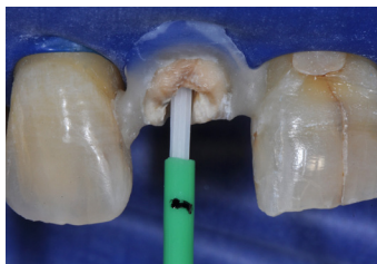
Caso clinico n.1

Conclusioni e compilazione questionario ECM