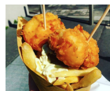
GNOKO ON THE ROAD I BACCALÀ EL CAMINANTE

Ciascun evento è accreditato ai fini del conseguimento di n° 4 crediti formativi professionali per i geometri iscritti all'Albo provinciale di appartenenza