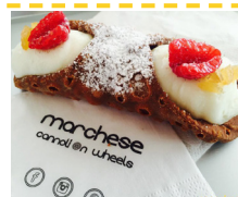
GNOKO ON THE ROAD LAS BRAVAS MARCHESE CANNOLI