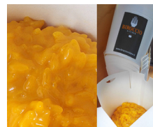
GNOKO ON THE ROAD BIROCCIO MARCHESE CANNOLI