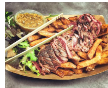
GNOKO ON THE ROAD THE ROLLING STAR MARCHESE IRIS

Genere: Funky, blues e jazz in dialetto milanese