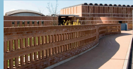
Planimetria del complesso scolastico e vista dalla strada di accesso.